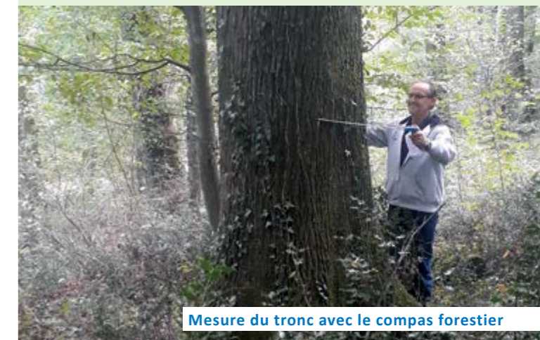
Mesure du tronc avec le compas forestier