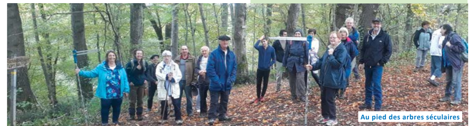
Au pied des arbres séculaires

Deux réunions se sont tenues à la mairie de Valentine avec le syndicat « Garonne amont » pour inventorier la situation liée aux inondations autour de la mouillasse et les solutions à apporter. Des actions approfondies seront réalisées par le Syndicat. Les premiers travaux ont commencé suite à un endommagement des piliers du pont dû aux anciennes crues ; un enrochement a été effectué par le SIVOM avec remodelage des berges et du lit du Rieutord sur cet espace.