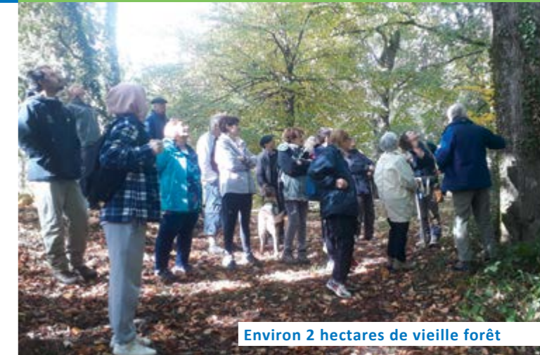
Environ 2 hectares de vieille forêt